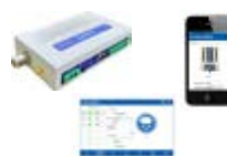
SATLINK 3 LITE

SUTRON soluções em, telemetria e softwares e dataloggers.