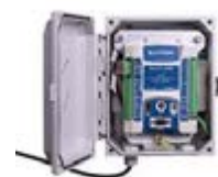
SUTRON XLINK 100/500